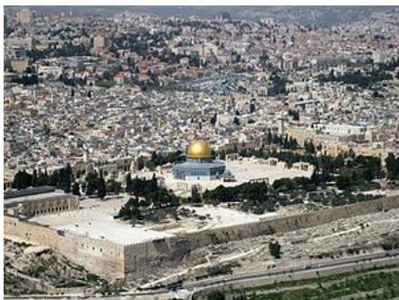
Chrámová hora od jihovýchodu

Huguesovi byly svěřeny vědomosti o „Grálu“. V souvislosti s tím na konci roku 1093 (když Hugues po smrti svého bratra zdědil hlavní město Champagne - Troyes) se dvanáct lidí pověřených Huguesem vydá na tajnou misi do Jeruzaléma. Přestrojili se, někdo jako poutník, někdo jako obchodník, někdo jako žebrák a někteří například jako pomocníci v útulku, ve kterém žila skupina křesťanů, většinou původem z Evropy. Starali se o nemocné a mrzáky. Lidé je označovali za „ milosrdné bratři svatého Jana“, protože vedle domů, kde bydleli, byly postaveny dvě kaple. Jedna z nich patřila mužskému klášteru a byla zasvěcena Janovi, kanonizovanému patriarchovi Alexandrijskému, který byl za svého života znám svými dobročinnými skutky. A druhá kaple byla ženská, zasvěcená Marii Magdaleně.